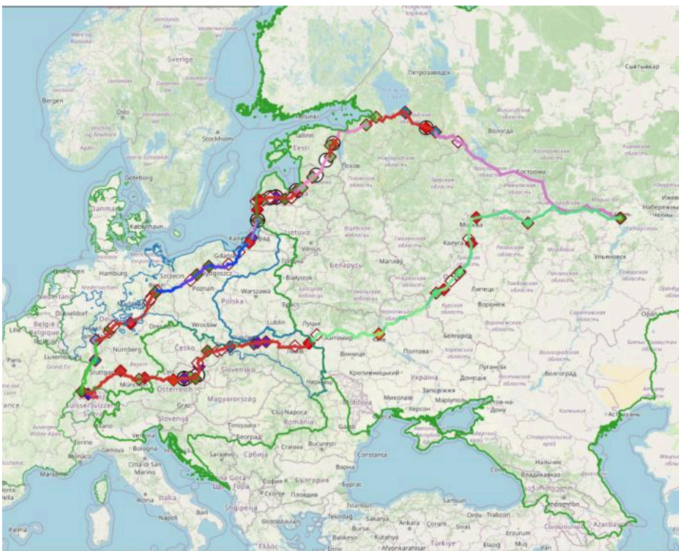
Karte: "Punkte mit Frauen" und "Geschlechtertrennung". Beyer-Thoma, Hermann, Rechte vorbehalten - freier Zugang

Auch die gar nicht figurbetonte traditionelle russische Frauenkleidung fand bei dieser Gelegenheit keine Gnade vor den Augen unseres reisenden Ästheten, der ja aus einer Welt der Schnürbrüste kam.