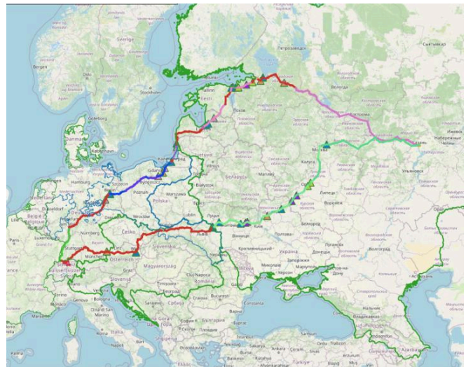
Karte: "Punkte mit Beamten". Beyer-Thoma, Hermann, Rechte vorbehalten - freier Zugang