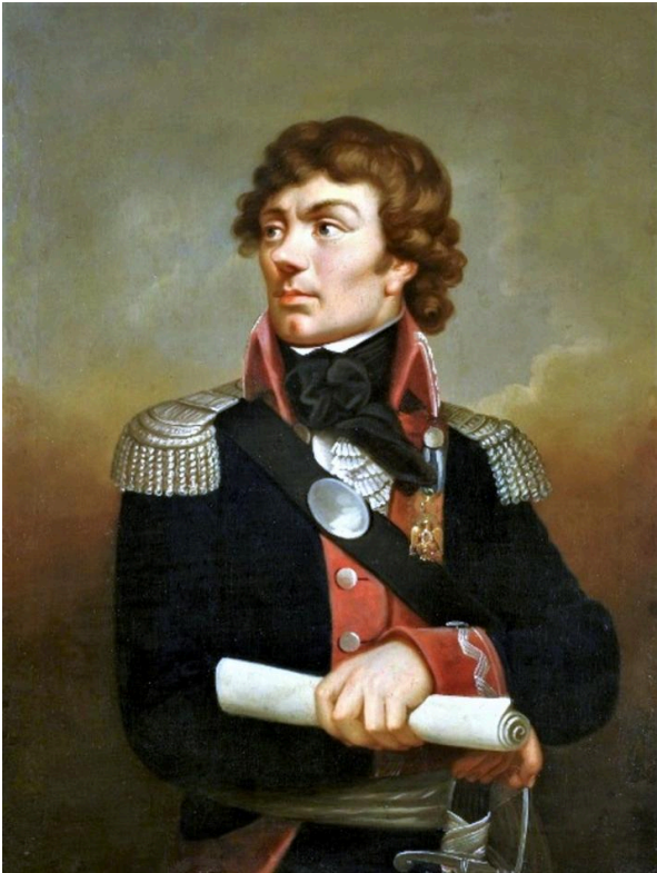
Karl Gottlieb Schweikart: Porträt von Tadeusz Kościuszko (nach 1802). Der Kościuszko-Aufstand fiel 1794 vor allem in Warschau auf fruchtbaren Boden. Wikimedia Commons, CC0 1.0

Während viele enttäuschte Verfechter der polnischen Unabhängigkeit und vor allem die meisten Magnaten