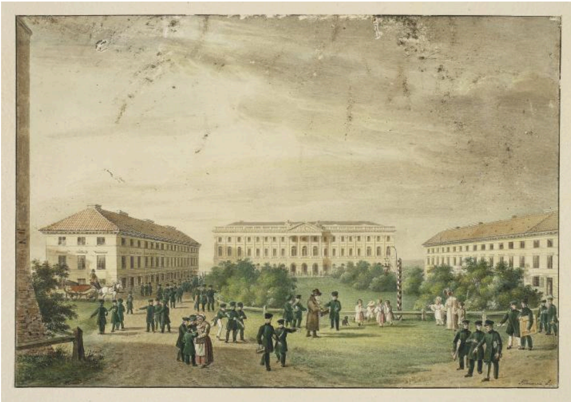
Jan Feliks Piwarski: Das Lyzeum im Kazimierz-Palast (1824). Der Kazimierz-Palast (poln. Pałac Kazimierzowski) beherbergte vor der preußischen Besetzung Warschaus die Kadettenschule und ab 1817 das Lyzeum.

Bildungsreformer tätig gewesen. Das Warschauer Lyzeum bündelte damit in gewisser Weise preußische und polnische Reformbestrebungen.