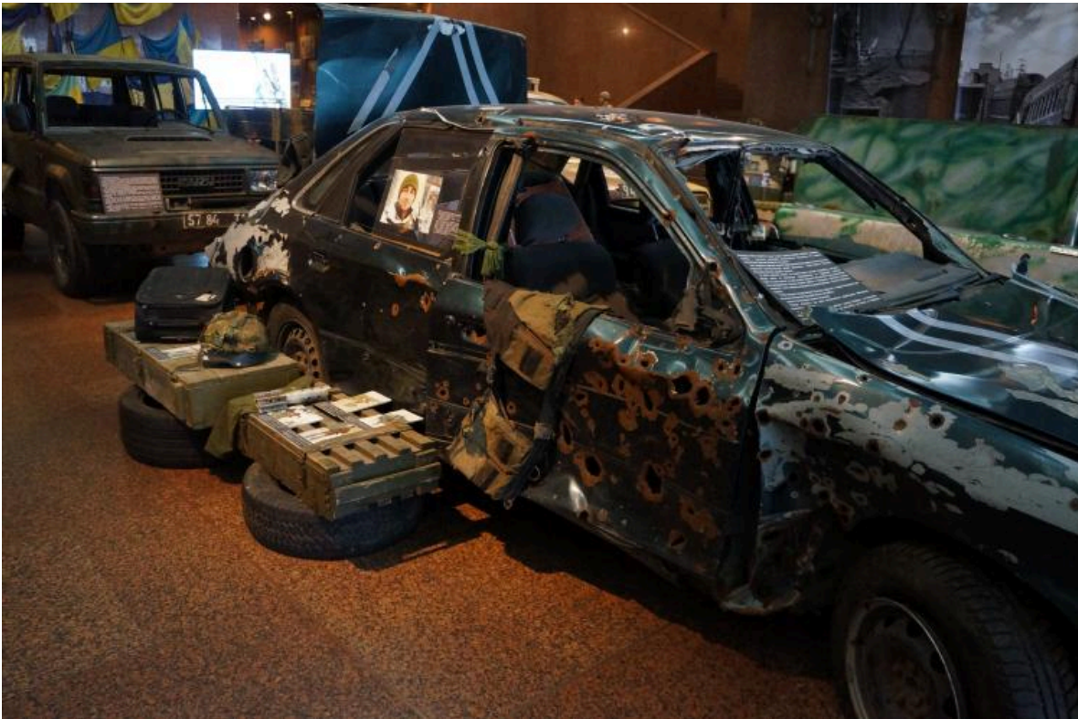
Die Ausstellung "Ukrainischer Osten", die dem Krieg im Donbas gewidmet ist, befindet sich im Erdgeschoss des Museumsgebäudes. September 2018.

Bild der Ausstellung "Ukrainischer Osten", die der russischen Aggression und den militärischen Operationen im Osten des Landes gewidmet ist.