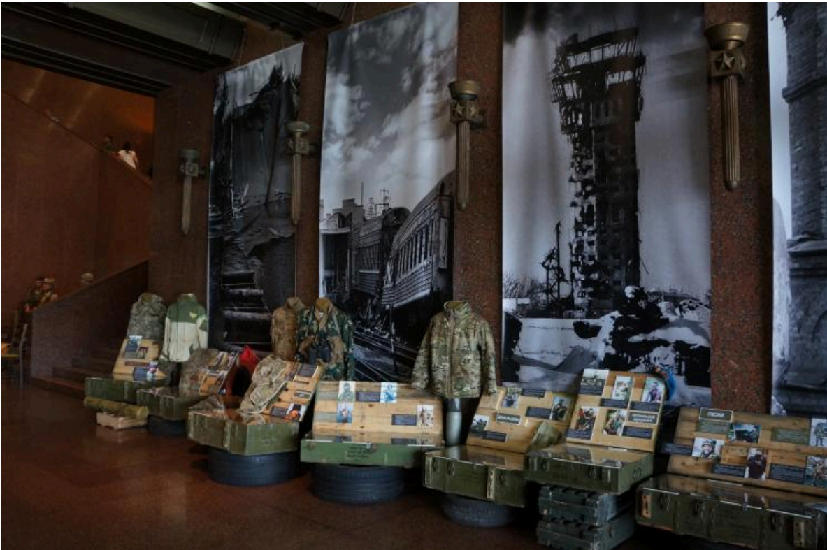
Die Ausstellung "Ukrainischer Osten", die dem Krieg im Donbas gewidmet ist, befindet sich im Erdgeschoss des Museumsgebäudes. September 2018.

Bild der Ausstellung "Ukrainischer Osten", die der russischen Aggression und den militärischen Operationen im Osten des Landes gewidmet ist.