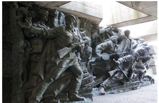
Die Statue zeigt den Kampf der sowjetischen Armee und der Zivilbevölkerung während des Zweiten Weltkrieges gegen das NS-Regime auf.