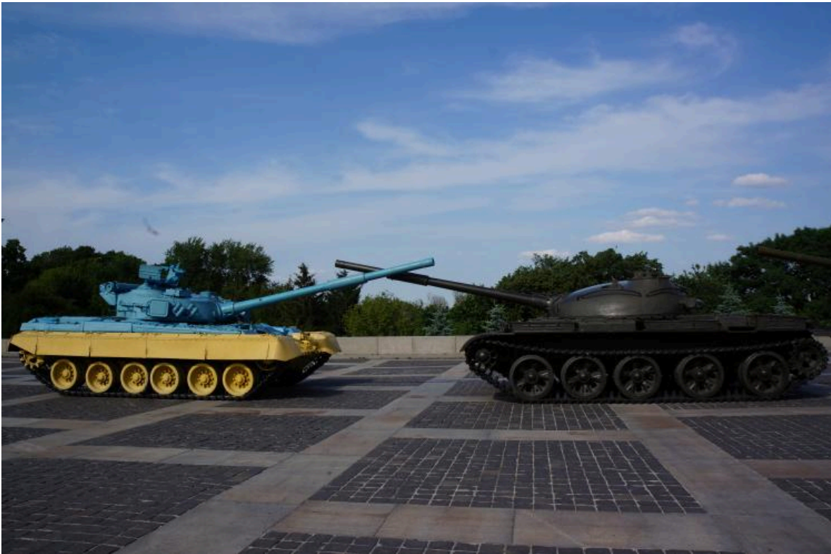
Ausstellung russischer Kriegstrophäen, schwere Fahrzeuge T64-BV, die während der "Anti-Terror-Operation" 2014 im Donbas erbeutet wurden. September 2018.

Ausstellung von russischen Kriegstrophäen. Der Beschreibung zufolge handelt es sich bei diesen Gegenständen um materielle Beweise für Verbrechen, die von prorussischen militanten Gruppen, die von den Streitkräften der Russischen Föderation unterstützt werden, auf dem Gebiet der Ukraine begangen wurden.