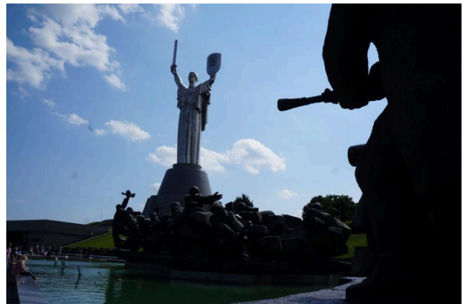
Das Emblem der UdSSR auf dem Schild, welches die Statue trägt, wurde erst im August 2023 entfernt und durch das Wappen der Ukraine ersetzt. Juni 2017.

Das Kiewer Kriegsmuseum ist für Ukrainer:innen ein besonderer Ort. Das Museum und die umgebende Gedenkstätte wurden am 9. Mai 1981 als Raum zur Feier des sowjetischen Sieges im Großen Vaterländischen Krieg 1941–1945 eröffnet. Die monumentale Architektur und das Pathos dieses Ortes sollten die Kraft, den Mut und die Opferbereitschaft derer würdigen, die