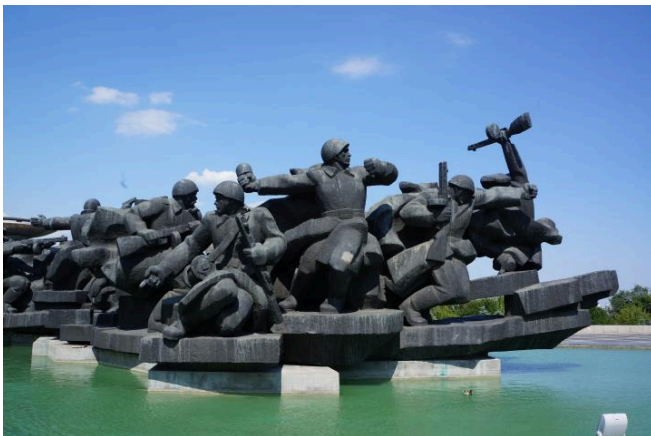
Die Statuengruppe feiert die Stärke, den Mut und die Aufopferung der Soldaten der Roten Armee, die ihre Gesundheit und ihr Leben für den sowjetischen Sieg geopfert haben. Juni 2018. Elżbieta Olzacka, CC BY-NC-ND 4.0

Seit der Unabhängigkeit der Ukraine im Jahr 1991 hat die Übersättigung mit sozialistisch-realistischer Architektur und kommunistischen Symbolen nicht dazu beigetragen, mit der sowjetischen Art der Erinnerung und Darstellung des Kriegserbes zu brechen. Im Jahr 1996 erhielt das Museum den Status eines nationalen Museums. Es engagierte sich zunehmend für eine ukrainisch geprägte Perspektive auf den Zweiten Weltkrieg und für das Gedenken an alle Teilnehmer:innen des ukrainischen Unabhängigkeitskampfes, einschließlich jener Aufständischen, die der antisowjetischen Armee angehörten. Bis 2015 blieben jedoch sowohl der Name des Museums als auch die Prämissen der Hauptausstellung unverändert. Erst die „Entkommunisierungsgesetze“, die die Förderung der kommunistischen Symbolik untersagten und gleichzeitig neue, europäische Modelle des Gedenkens an den Zweiten Weltkrieg einführten, zwangen das Museum zu tiefgreifenden Veränderungen in Narrativ und Ästhetik. ↗