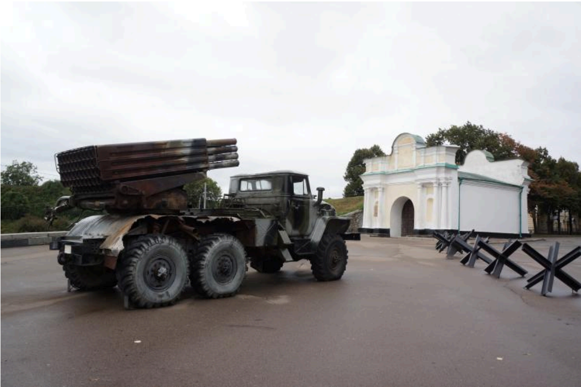
Ausstellung russischer Kriegstrophäen, hier der Bm-21-Grad-Raketenwerfer, der während der "Anti-Terror-Operation" im Jahr 2014 im Donbas erbeutet wurde. September 2018. Elżbieta Olzacka, CC BY-NC-ND 4.0

Panzerabwehr-Igel aus dem Zweiten Weltkrieg wurden im März 2023 bei den Versuchen der russischen Truppen, Kiew einzunehmen, erneut eingesetzt.