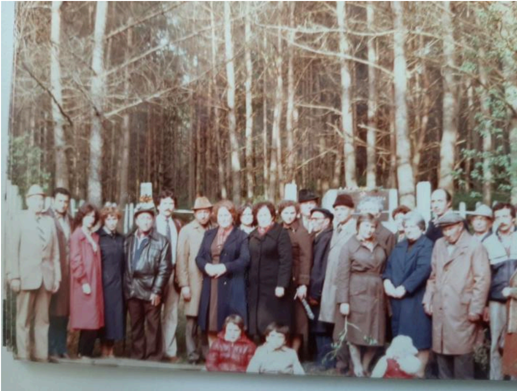
Holocaust-Überlebende am Erschiessungsort in Iuże, Belarus, 1983. Privatarchiv von Abba Rechte vorbehalten - freier Kawa, Zugang