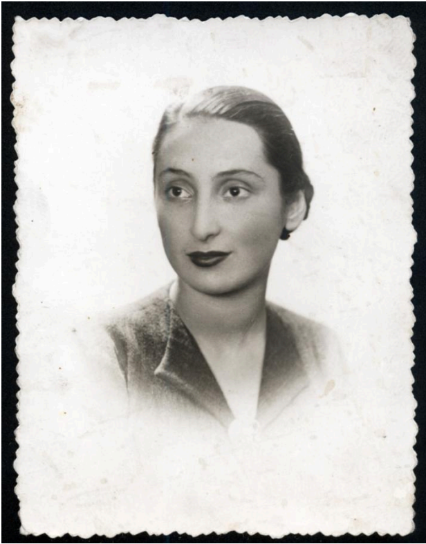
Zuzanna Ginczanka.