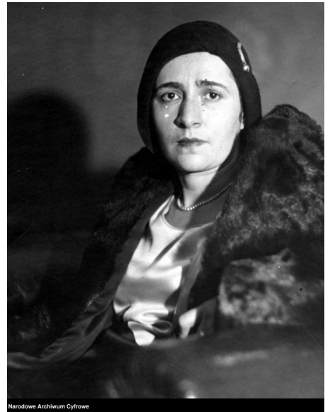
Irena Krzywicka.

Ich lebte ein sehr langes Leben ... Ich durchlebte alle erdenklichen Unglücke, den Holocaust selbst zwar nicht, aber ich verlor an ihn fast alle, die ich liebte. Man sagt über mich, ich sei ein Star gewesen. Ein Star der Salons. Ich galt als hübsch; ich führte ein interessantes und farbenfrohes Leben. Ich hatte wunderbare, treue Freunde, die ich innig liebte. Antoni Ślonimski war einer von ihnen, dann Jarosław Iwaszkiewicz ... Auch Tadeusz Boy-Żeleński spielte eine große Rolle in meinem Leben. Er war mein Maitre a penser, mein Lehrer und Mentor. Das Amüsante und eigentlich Paradoxe war, dass ich fast die gesamte polnische Schule der Mathematik kannte ... Ich habe so viele Menschen in meinem Leben gekannt... Ich kannte nicht nur polnische Schriftsteller, sondern auch viele französische Literaten ... Ich kannte Papst Johannes XXIII. Nach dem Krieg ... hatte ich fast alle meine Verwandten verloren; ich wandelte auf Gräbern. Ich dachte, ich würde es nicht überleben, ich würde nicht weiterleben können ... Aber ich lebe noch, verdammt noch mal, und ich lebe weiter