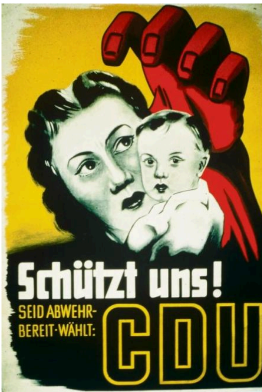
CDU-Wahlplakat für die Bundestagswahl 1953, das die Vorstellung illustriert, dass deutsche Frauen vor der kommunistischen Invasion geschützt werden müssen.

Untersuchungen zur antikommunistischen Propaganda in den frühen 1950er Jahren, dass der Antikommunismus nach 1945 weitaus weniger antisemitisch aufgeladen war; an die Stelle des Antisemitismus trat in der Regel der antislawische Rassismus. 13 Dies zeigt sich auch in den Wahlkampagnen der Christlich Demokratischen Union (CDU) in den späten 1940er und frühen 1950er Jahren. Die Wahlplakate der CDU veranschaulichten die Vorstellung, dass der Kommunismus eine Bedrohung insbesondere für deutsche Frauen und Kinder darstellt. 14 Diese vermeintliche Bedrohung durch den Kommunismus wurde gleichzeitig in einer deutlich antislawischen, rassistischen Bildsprache dargestellt.