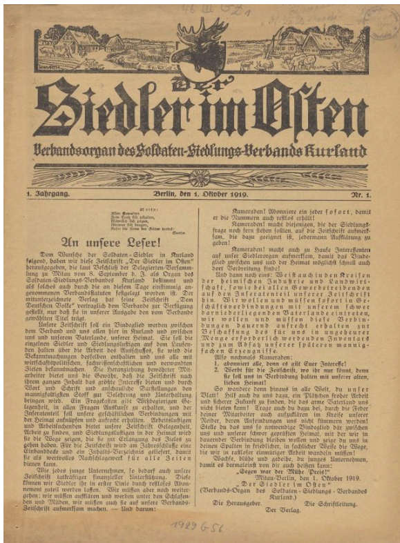
Titelblatt der Zeitung Siedler im Osten vom 1. Rechte vorbehalten - freier Oktober 1919. Zugang