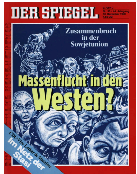
Spiegel Cover: Massenflucht in den Westen?. DER SPIEGEL 50/1990, Rechte vorbehalten - freier Zugang

Ein naheliegendes und bisher weitgehend brach liegendes Feld für die Untersuchung solcher Kontinuitäten und Wandlungen wäre der Kalte Krieg mit seiner gezielt gegen das östliche Europa gerichteten Komponente des Antikommunismus. Ab Ende der 1980er Jahre erlebten dann Abwertungen osteuropäischer Migrant:innen, die in größerer Zahl nach Deutschland kamen, eine erneute Konjunktur. Die wieder aufkommenden ‚Polenwitze‘ sind hierfür ebenso symptomatisch wie die Berichterstattung etwa des „Spiegel“ über eine „östliche Völkerwanderung“ oder den ‚kriminellen Osten‘. 17 Hier zeigt sich, dass vermeintlich vergangene Feindbilder noch vorhanden waren und reaktiviert werden konnten. Im Ergebnis dieser Angstdebatte durften die Bürger:innen der seit 2004 zur EU gehörenden baltischen und ostmitteleuropäischen Staaten