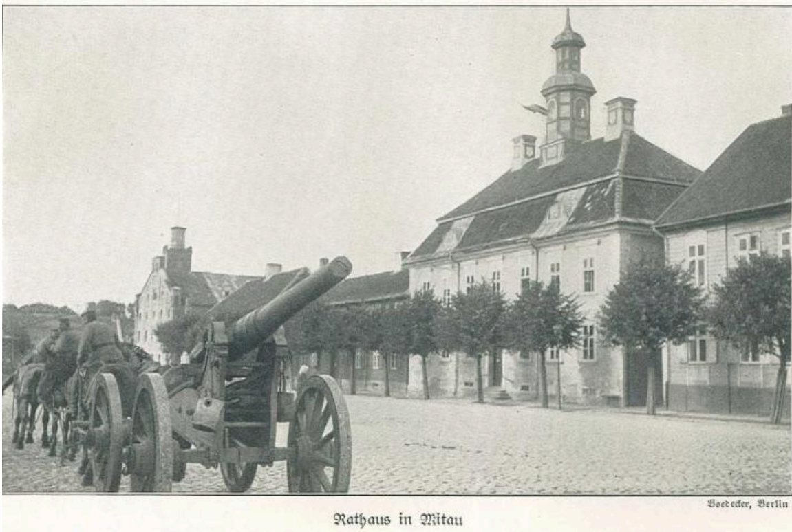
Fotografie: Deutsches Militär vor dem Rathaus von Mitau/Jelgava. Das Land Ober Ost. Deutsche Arbeit in den Verwaltungsgebieten Kurland, Litauen und Bialystok-Grodno. Hrsg. von der Presseabteilung Ober Ost. Stuttgart Berlin 1917, S. 337, CC0 1.0

Die Radikalisierung vollzog sich im Zusammenspiel mit anderen Diskriminierungsformen gegen Menschen aus dem östlichen Europa, insbesondere dem Antisemitismus und dem Antiziganismus. So verdichteten sich in der Figur des „Ostjuden“ alle negativen Stereotype über ‚den Osten‘ (z.B. Rückständigkeit, Schmutz) und ‚die Juden‘ (z.B. Geldgier, Amoralität) und machten sie zu einer besonderen Hassfigur der völkischen Rechten. 13 Heutzutage passiert ähnliches mit Sinti:zze und Rom:nja aus Südosteuropa.