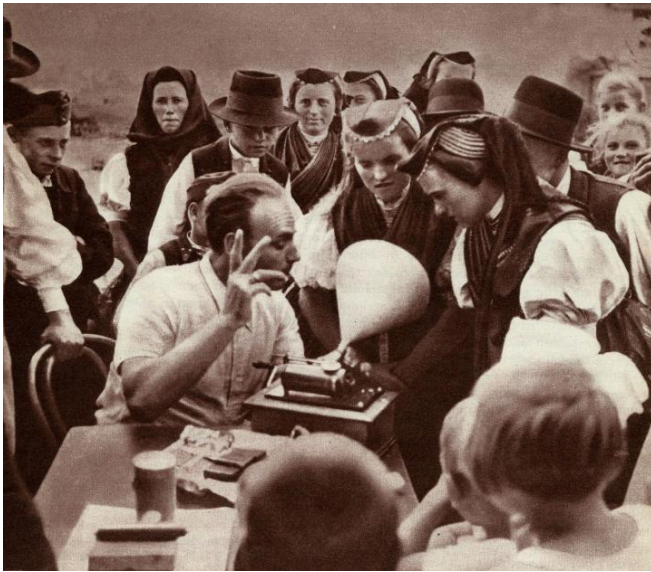
Küppers hielt mithilfe eines Phonografen auch das lokale Liedgut fest, Abb. in: Gustav-Adolf Küppers Sonnenberg, Einbeiner am Steuer. Eine Balkanfahrt, Hannover 1937, Rechte vorbehalten - freier S. 20. Hanomag, Zugang

durch das Propagandaministerium gefördert wurden, machen seine spätere Behauptung von einer klaren Regimegegnerschaft wenig glaubhaft.