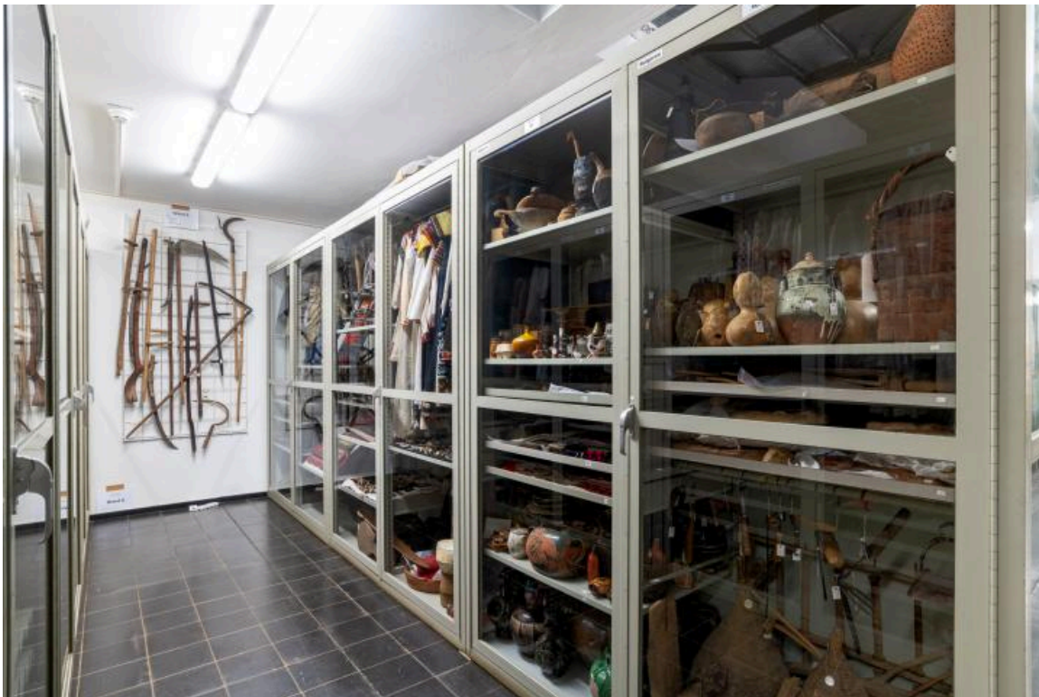
Bulgarien-Abteilung im Depot des Museums Europäischer Kulturen.