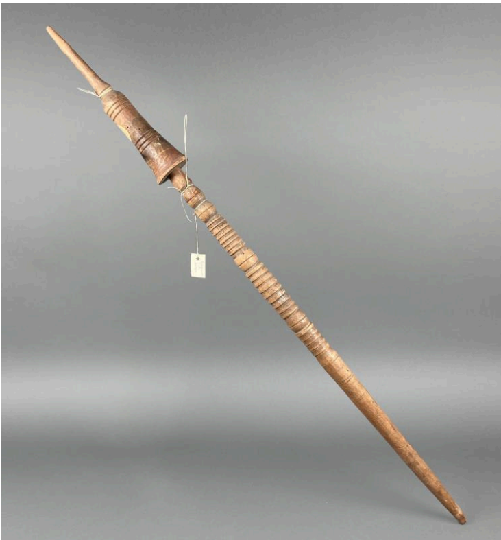
Matthias Thaden / Staatliche Museen zu Berlin, Museum Europäischer Kulturen, CC BY-SA 4.0

dabei wesentlich gewesen sein dürften. So war Küppers schon früh zur Überzeugung gelangt, „dass unsere Kultur vor dem sicheren Untergang nur durch Verwurzelung der Intelligenz mit der Scholle [...] gerettet werden“ und nur so die „Grundlage für den Neubau des Volkstums“ gelingen könne. 24 Noch drei Jahre nach seiner letzten Reise argumentierte er äußerst engagiert dafür, dass diese „Bindung zur Scholle“ auch museal zu dokumentieren sei. Mit einer durchaus zynischen Argumentation warb er bei mehreren Akteuren für den Erwerb bulgarischer Holzpflüge. Diese werde es angesichts der durch die deutsche Kriegsführung erzwungenen Rationalisierung der örtlichen Wirtschaft nicht mehr lange geben, sodass dieses Gerät von deutschen Museen nun für die Nachwelt zu retten sei. 25