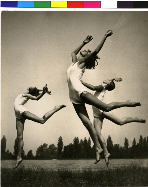
Leichtathletik, 1930. B01.0244.(1392)