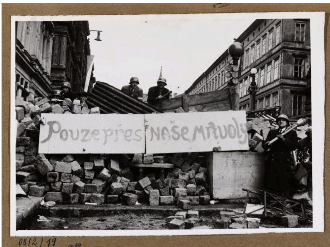
Eine der vielen nach dem 5. Mai errichteten Barrikaden der Prager Aufständischen. Die Aufschrift lautet: „Nur über unsere Leichen“, Ort: am Prager Nationaltheater. Květnové povstání 1945 (Maiaufstand/May Uprising 1945), Sign. NAD 1330; 08-2-19 / Národní archiv

Die sowjetischen Truppen marschierten in eine überwiegend befreite Stadt ein. Bereits vier Tage zuvor, am 5. Mai 1945, hatte der Prager Aufstand gegen die deutschen Besatzer begonnen.