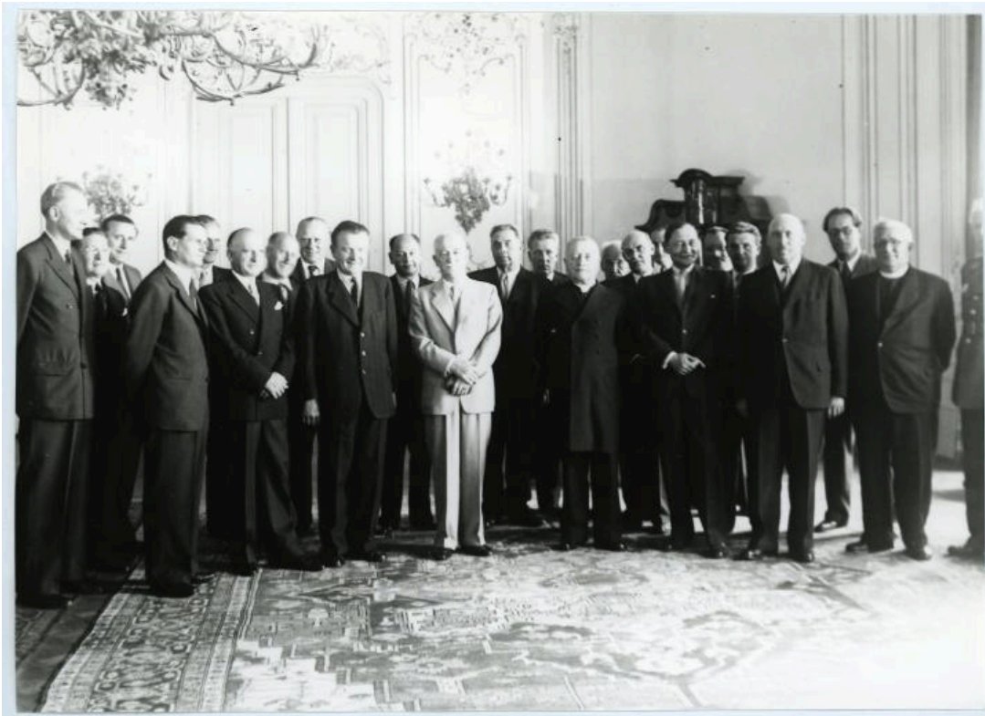
Ministerpräsident und KSČ-Vorsitzender Klement Gottwald (1. Reihe, 3. v. l.) mit der neuen Regierung bei Präsident Edvard Beneš (4. v. l.) auf der Prager Burg am 3. Juli 1946. Sign. NAD 1327, 02/67953/1

Obwohl die Wahlen insbesondere wegen einer beschränkten Zahl an zugelassenen Parteien und ohne Opposition heute als nicht völlig demokratisch eingestuft werden, galten sie damals unter den angetretenen Parteien als weitgehend frei und wurden akzeptiert. Tatsache bleibt jedoch, dass die KSČ zwar als stärkste Kraft aus den Wahlen hervorging, aber nie die absolute Mehrheit erlangte. In den folgenden Jahren formte sie die Tschechoslowakei trotzdem in eine kommunistische Diktatur um.