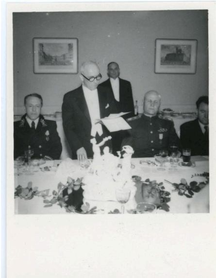
Rezeption zu Ehren der sowjetischen Marschälle auf der Prager Burg am 6. Juni 1945 (v. links: sowjetischer Botschafter Valerian Zorin, Edvard Beneš, Marschall Ivan Konev, Klement Gottwald).

unter ihrem Einfluss. Auch im Kulturmilieu gab es viele Unterstützer.