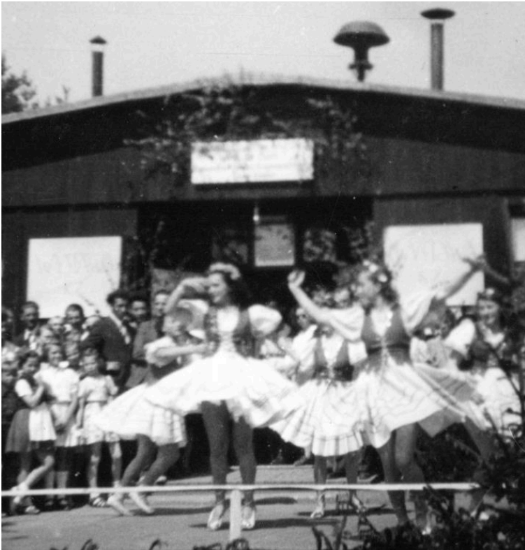
Polnischer Nationalfeiertag am 3. Mai 1946 im DP-Camp „Putaski“ in Weiden in der Oberpfalz. Gemeinsame Feierlichkeiten spielten zur Gemeinschaftsbildung eine wichtige Rolle.

Singen der Nationalhymne.“ 13 Mit Tränen in den Augen sang er: „Noch ist Polen nicht verloren.“ Die kommenden Wochen verglich er mit einem Aufenthalt in einem Kurort. Er genoss ausgelassene Tanz- und Revueabende, auch wenn er selbst wegen einer Fußverletzung nicht mittanzen konnte.