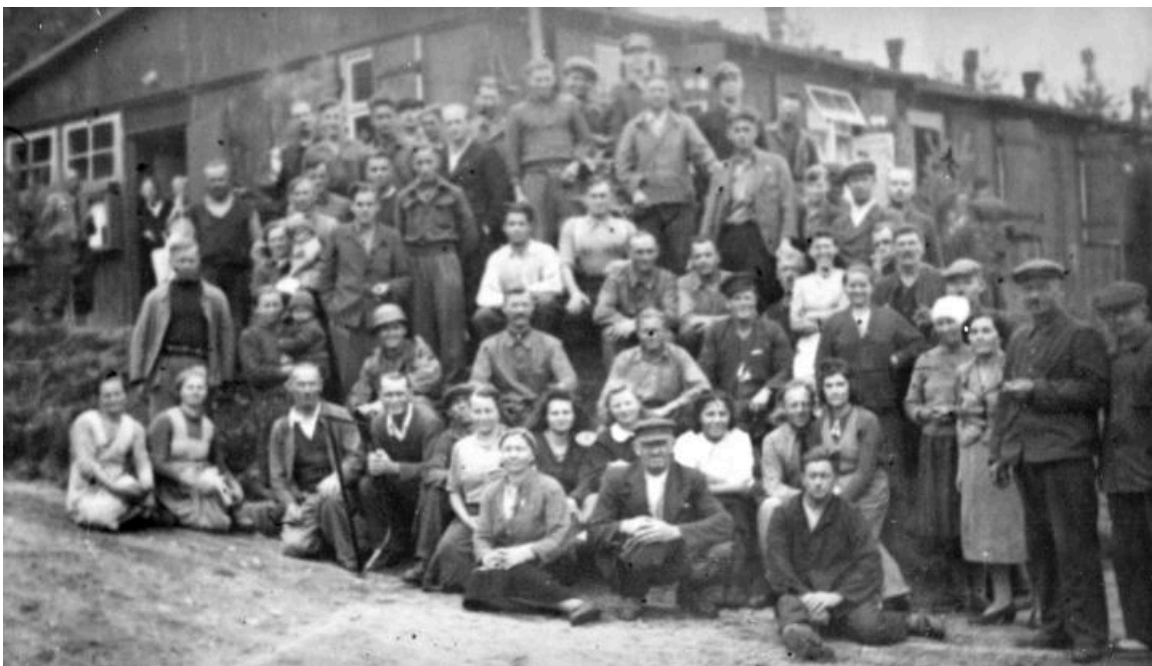
Eine Gemeinschaft im Exil, hier polnische Displaced Persons im Camp „Pułaski“ in Weiden in der Oberpfalz, 1945 oder 1946. Privatbesitz E. Hejka, Australien. Zugang Rechte vorbehalten - freier

Der von den Alliierten zunächst als kurze Übergangszeit verstandene Aufenthalt in DP-Camps wurde somit zu einem andauernden Zustand. In den Camps übernahmen gewählte wie selbsternannte Eliten Aufgaben in der Selbstverwaltung. Viele förderten das jeweilige Nationalbewusstsein, verstanden sich als Antikommunist:innen und stilisierten sich und ihre Landsleute in den DP-Camps als die wahren Repräsentant:innen ihres Landes. Sie verstanden ihre Heimat, beispielsweise die Ukraine, als von den Sowjets besetzt und propagierten einen Kampf gegen die Etablierung sowjettreuer Regime, was die Einstellung gegen Repatriierungen verstärkte. 6