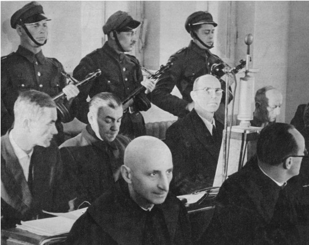
Dritter Prozess vor dem Obersten Nationalen Tribunal 1946/47, v. l. in der zweiten Reihe: Ludwig Fischer, Ludwig Leist, Josef Meisinger und Max Daume; Aufnahme von 1947.

Anders als die politischen Schauprozesse gegen die Gegner des neuen Machtregimes jener Zeit hielten sich die Prozesse des Tribunals an internationale und polnische Rechtsnormen. Die Bedeutung der Beweismittel und der Dokumentationsmaterialien – gesammelt von eigenen oder unterstützenden, darunter jüdischen, Organisationen – sowie die Zeugenaussagen garantierten die Rechtsstaatlichkeit des Verfahrens. Die Urteile zeugen von einer differenzierten und an die Einzelfälle angepassten Herangehensweise. Bei allen Prozessen gab es nur Pflichtverteidiger, was der Stimmung innerhalb der polnischen Bevölkerung entsprach. Jegliche andere Lösung wäre als Unterstützung für die Besatzer angesehen und per se abgelehnt worden.