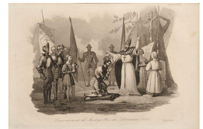
Krönung des Mindaugas, Lithografie, ca. 1830–1840. Inv.- Nr. LDKVR VR 619

Die 20 Mitglieder des litauischen Rates (Taryba), die am 16. Februar 1918 die Unabhängigkeitserklärung in Vilnius unterzeichneten.