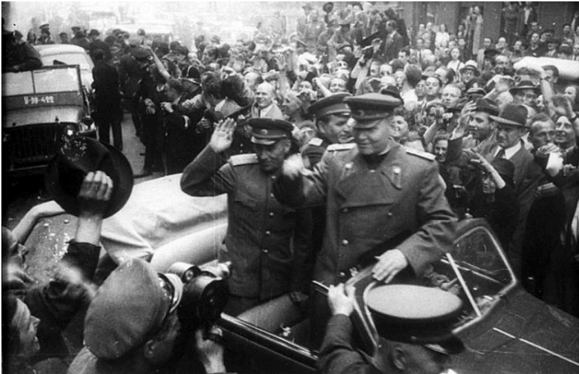
Marschall Konev bei der Befreiung von Prag am 9. Mai 1945.