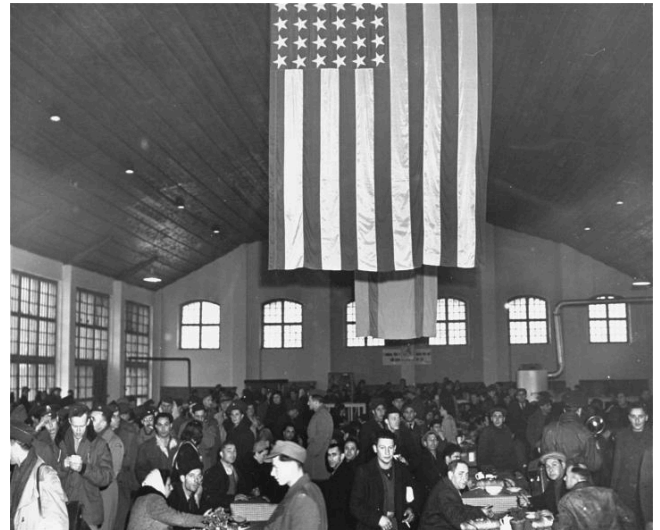
Jüdische DPs essen im Hauptspeisesaal des Landsberger DP-Lagers, 1945.