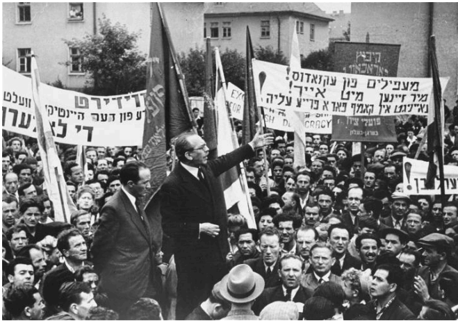
Demonstration im DP-Lager Bergen-Belsen gegen die Zwangsrückführung der Passagiere des Flüchtlingsschiffes Exodus 1947 nach Europa, 1947.

Kontakte zur einheimischen Bevölkerung gab es, wie bereits erwähnt, nur selten: „In den Berichten ehemaliger DPs waren die DP-Lager regelrechte Mikrokosmen, separate Welten – jüdische, polnische oder ukrainische Inseln auf der Landkarte Nachkriegsdeutschlands.“ 2 Schließlich hatten die Schejres Haplejte nicht vor, in Deutschland zu bleiben.