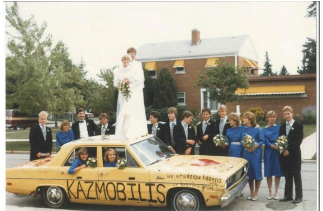
Das „Hochzeitsmobil“ im Mittelpunkt einer lettisch-amerikanischen Hochzeit im Jahr 1985.