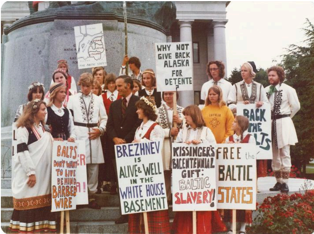
Schüler und Lehrer aus einem lettischen Sommerlager demonstrieren am 30. Juli 1975 in Olympia, Washington State.