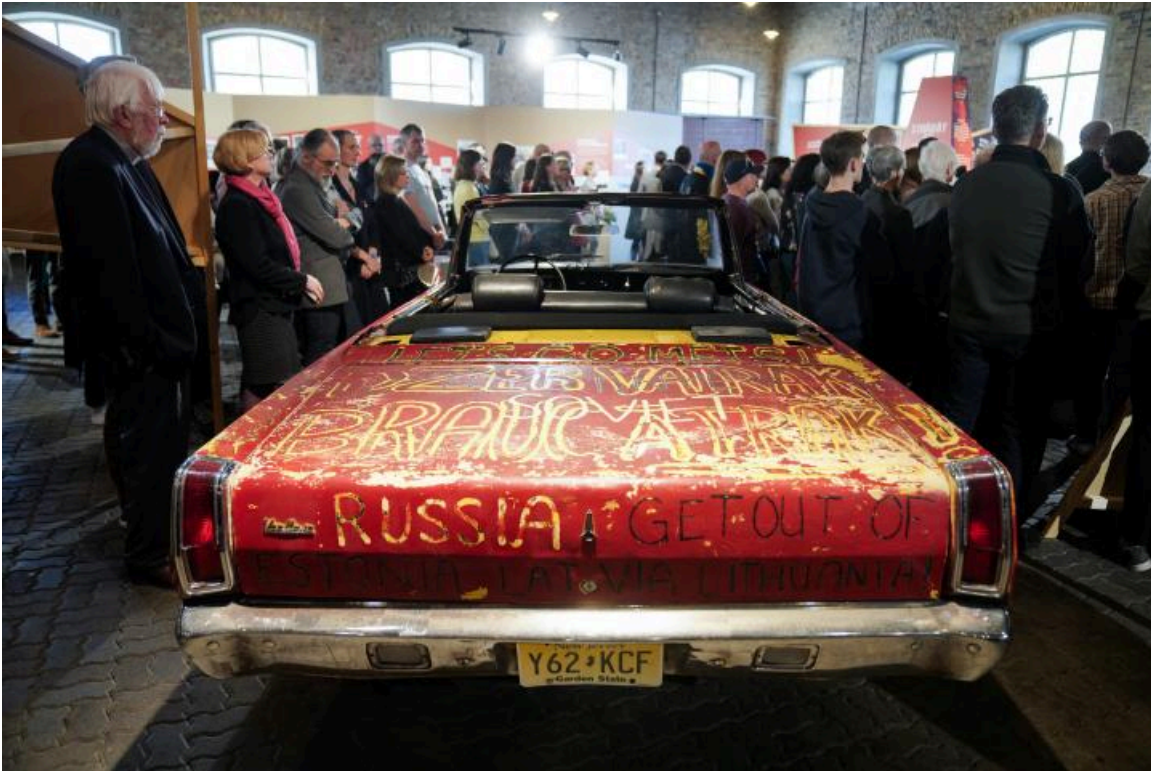
Der Valiant im Zentrum der Ausstellung „Nyet, Nyet Soviet!“ in Riga 2022.