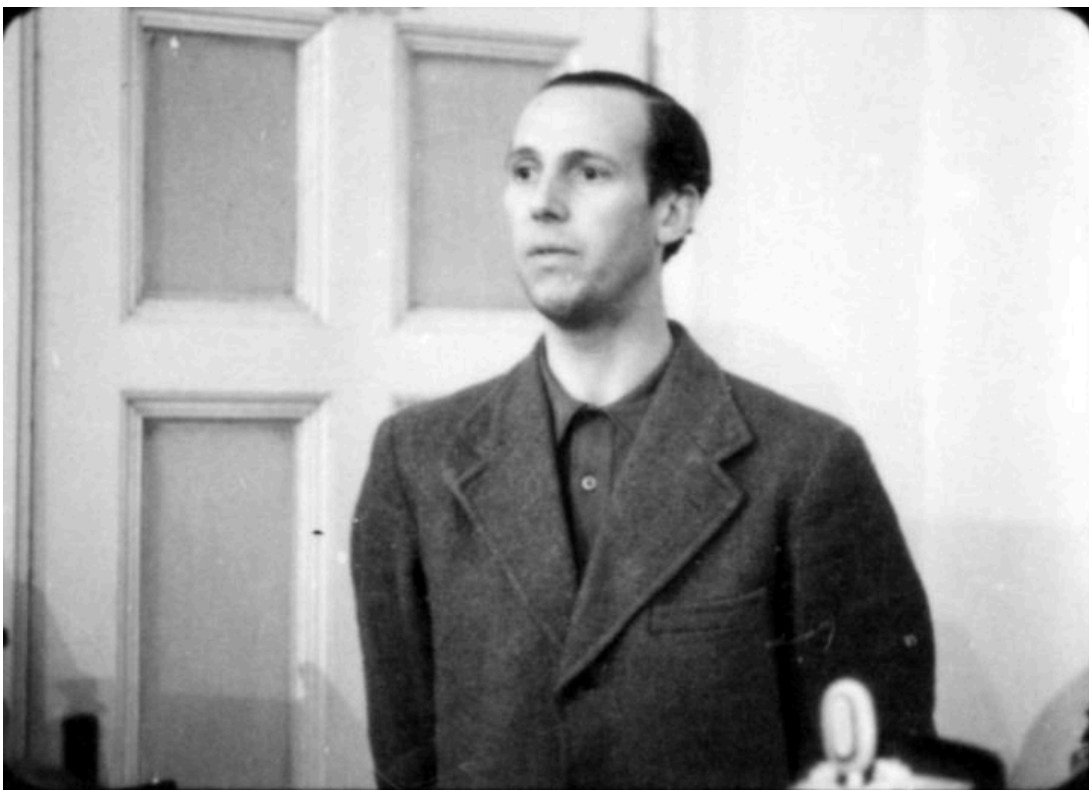
Heinrich von Lehndorff vor dem Volksgerichtshof, August 1944.

„Dass jemand mit ganz klarem Verstand weiß, dass er am nächsten Tag nicht mehr auf dieser Welt ist. Und was hinterlässt er seinen Lieben, seinen Nahen? Und manche hinterlassen auch der Menschheit was in diesem Moment. Es gibt in der antiken Dramatik diesen Moment von Antigone, die sozusagen am Ende ihres Lebens noch mal einen Gruß an die Stadt gibt. Wir sind an der Stelle vielleicht das einzige Mal in der Gattung alle gleich, an dem Punkt, wo wir uns von diesem Leben verabschieden. Also in dem Sinne sind es Dokumente über den Kern des Menschen letzten Endes, die dann nicht mehr ideologisch verstellt sind oder in einer Pose verharren.“