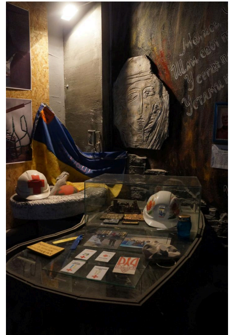
Das Innere des Museums der Himmlischen Hundert in Iwano-Frankiwsk ist das Ergebnis einer Zusammenarbeit zwischen Künstler:innen, Aktivist:innen und Beteiligten der Ereignisse, Oktober 2018.