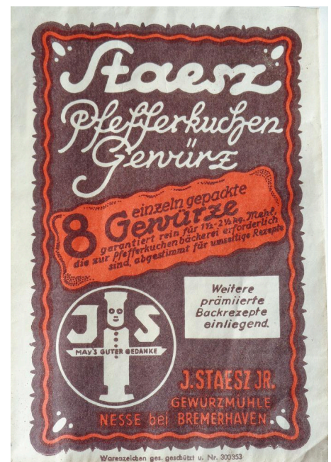
Ein historischer Beutel Pfefferkuchengewürz der Marke "Staesz-Pfefferkuchengewürz".