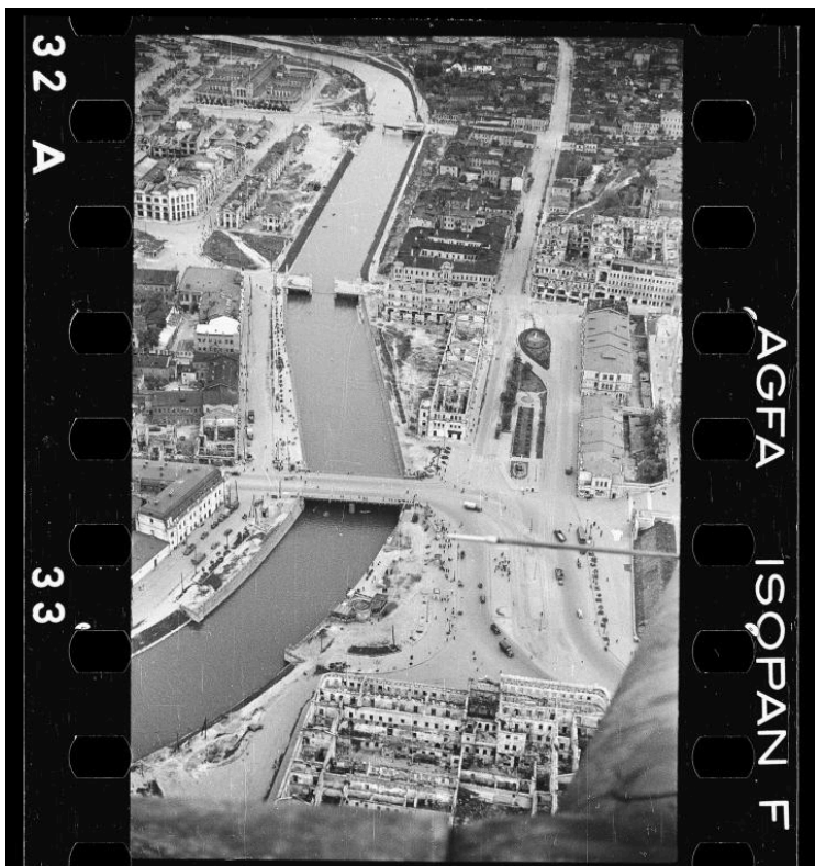
Der Fluss Lopen.

vielleicht war die Tüte undicht, denn dahinter bildete sich eine Art Wirbel aus Zuckersand. Dieser Nachbar, Onkel Kolja, war betrunken und völlig aufgebracht. Aber warum? Wie sich herausstellte, waren die Lagerbestände von ‚KOFOK‘ geöffnet worden. Dort gab es diese Tanks ... mit Alkohol. Damals ertranken dort mehrere Menschen – volltrunken. Einige Leute hatten Behältnisse, Eimer oder Büchsen, aber Onkel Kolja hatte keinen Behälter und schleppte deshalb nur Zucker. Er war betrunken, er hatte sich dort einen angetrunken, dennoch war er verzweifelt, weil er kein Gefäß mitgenommen hatte... Wir nahmen nichts, aber unten im ersten Stock (wir wohnten im zweiten Stock) wohnte eine Familie. Sie brachten acht Säcke mit Mehl und Nudeln.“